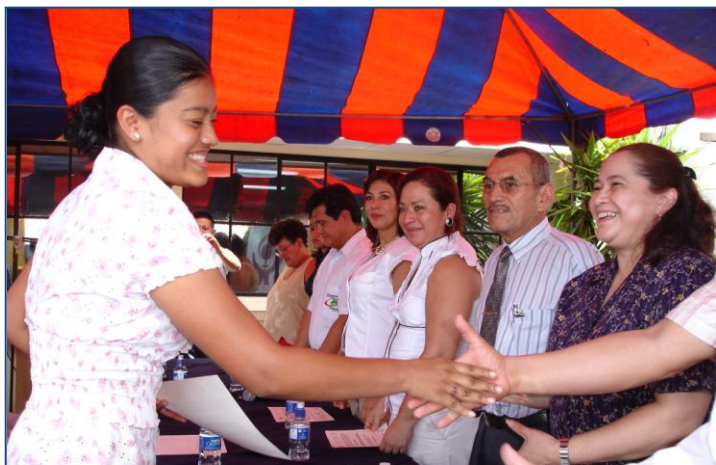
La ocasión también fue aprovechada para realizar la graduación de más de 30 mujeres, entre jóvenes y adultas que completaron los talleres impartidos por ORMUSA, en pintado en añil, bisutería, y elaboración de encurtidos.