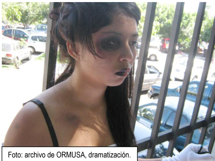
dramatización.