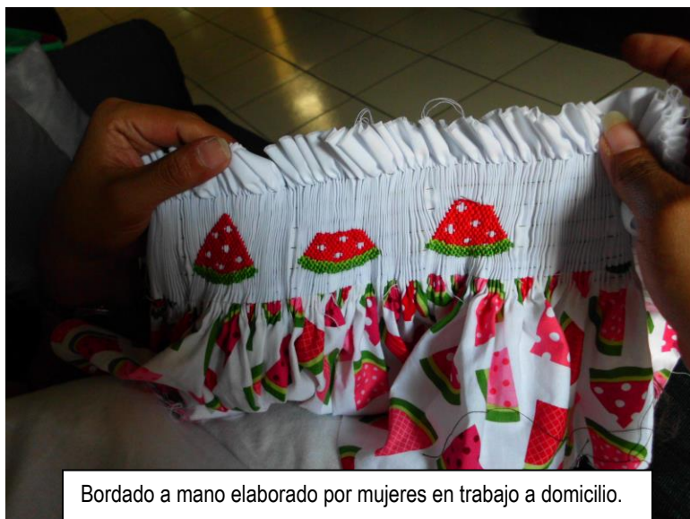
Bordado a mano elaborado por mujeres en trabajo a domicilio.

En este tema, se puede constatar que la brecha de género salarial persiste. El ingreso promedio de la población ocupada en el país es de $334.66; los hombres perciben un ingreso promedio de $347.62; mientras que las mujeres de $318.47; lo que significa que los hombres reciben $29.15 ó 9.2% más de ingreso promedio mensual que las mujeres