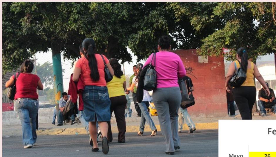
Feminicidios por mes